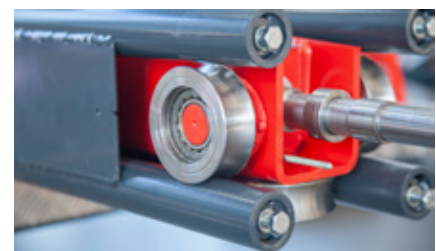
Stabile, geschweißte Säule und rollengelagerter Hubstuhl